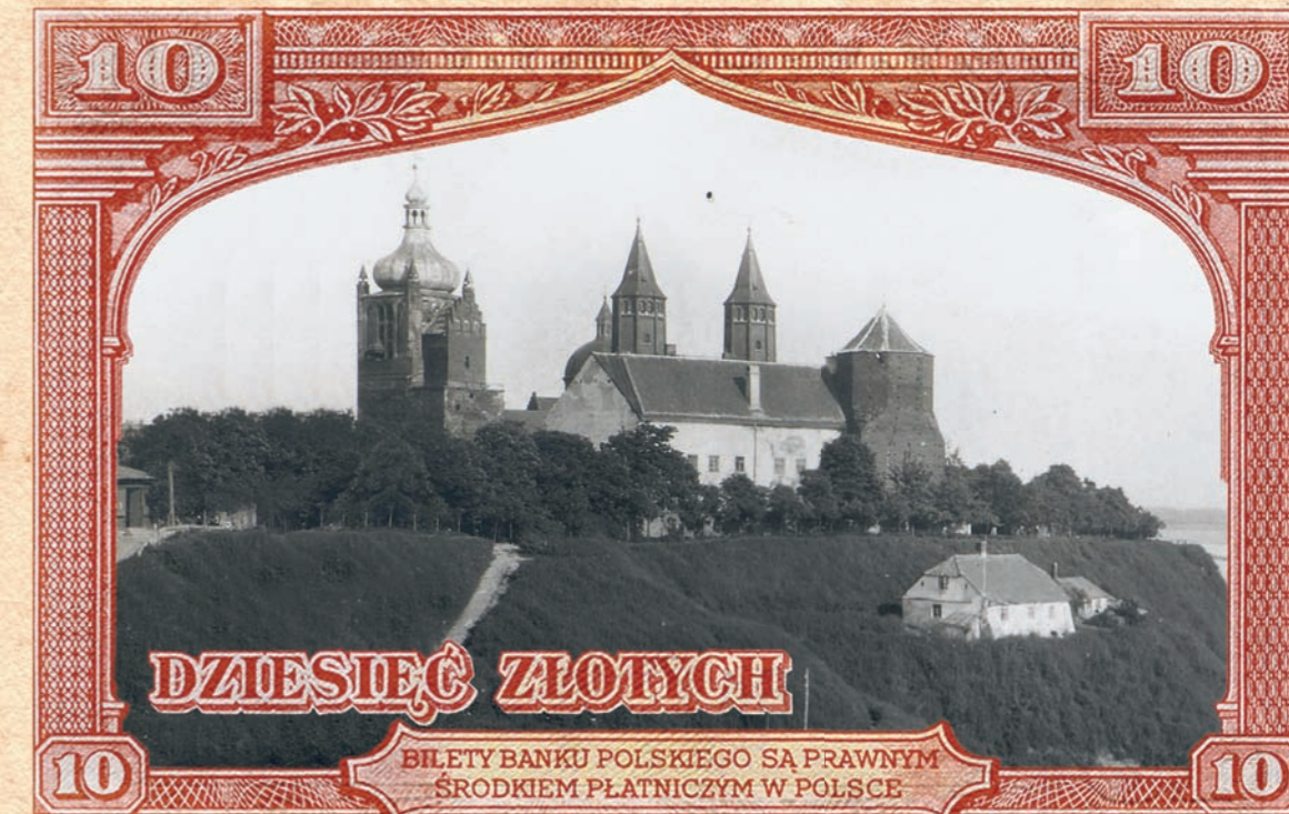
Banknot o nominalie 10 zł, emisja emigracyjna 15 sierpnia 1939 r.