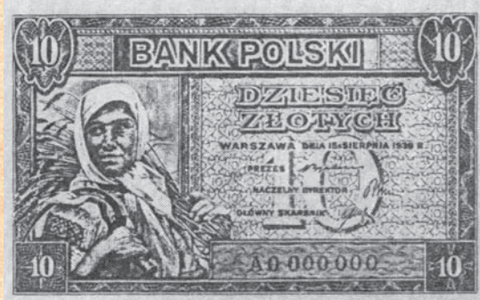
Niezrealizowana wersja banknotu 10. zlotowego.