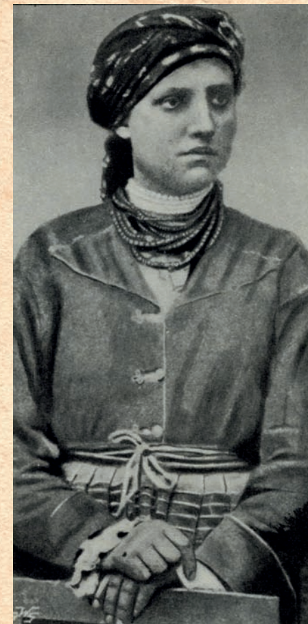
Dziewczyna spod Warszawy, Zygmunt Gloger, Encyklopedia Staropolska Warszawa 1900-1903

Artyści, nie znając polskiej wsi i strojów regionalnych, projektując, opierali się wyłącznie na dostępnych im wydawnictwach: encyklopediach i albumach etnograficznych. Głównym źródłem, z którego czerpali wizerunki potrzebnych postaci i krajobrazów, była Encyklopedia Staropolska Zygmunta Glogera (Warszawa 1900-1903), seria wydawnictw pod wspólnym tytułem Cuda Polski (Poznań 1935) oraz albumy fotograficzne Polska w krajobrazie i zabytkach (Warszawa 1930).