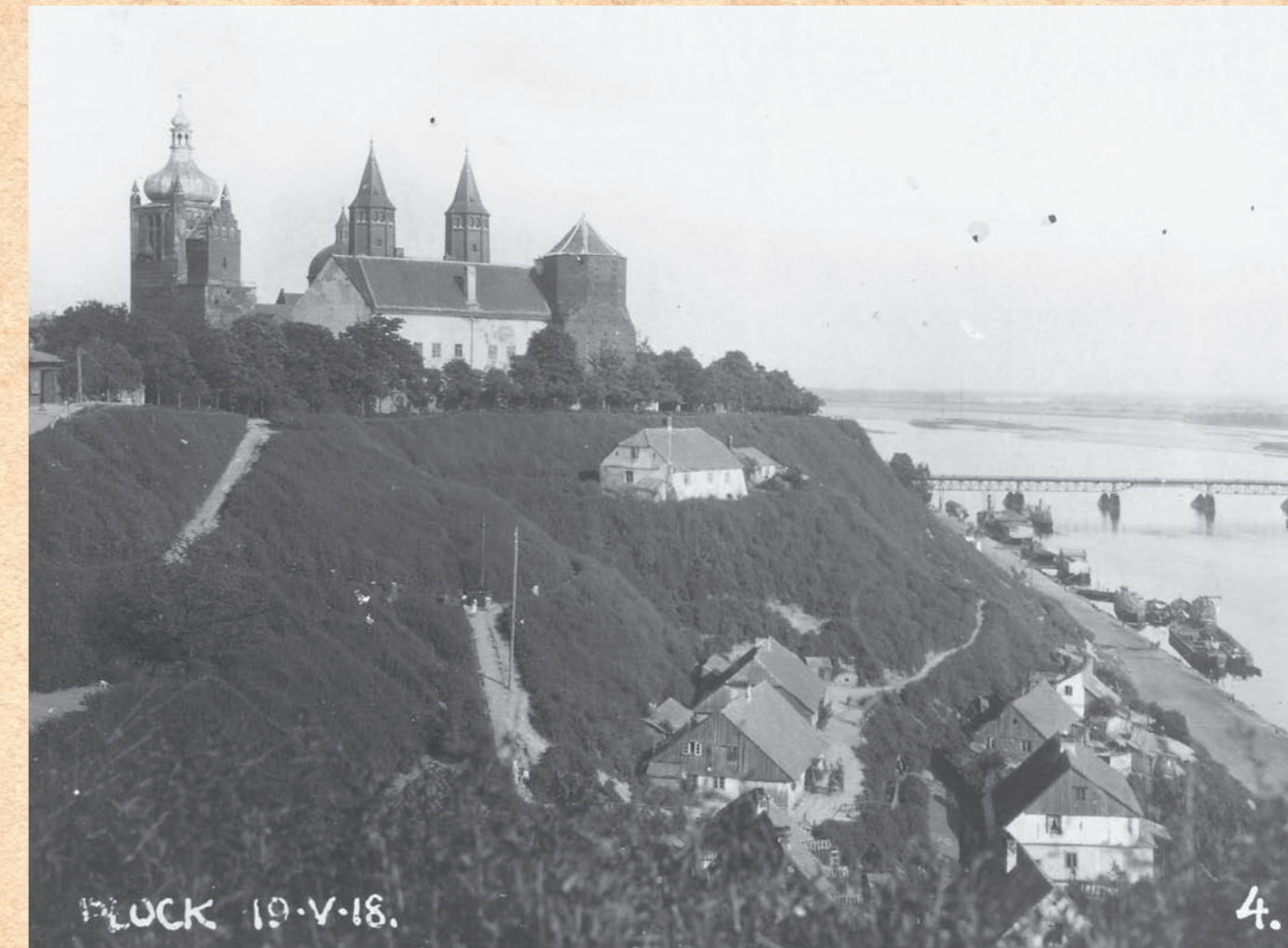
Fotografia Wzgórza Tumskiego, która stała się wzorem do projektu rewersu banknotu 10. złotowego.