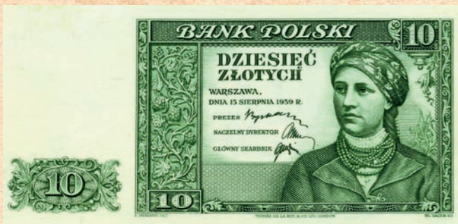
Banknot próbny wydrukowany techniką stalorytniczą w kolorze zielonym na papierze bez znaku wodnego i oznaczenia serii.

Nominały 10, 20, 50, 100, 500 zł zostały wydrukowane przez wytwórnię banknotów Thomas de la Rue w Londynie (ta sama firma drukowała banknoty podenominacyjne w 1994 roku). Próbne wydruki banknotu 10. zlotowego zostały wykonane w kolorze zielonym. Zachowało się kilka unikalnych odbitek w tym kolorze.